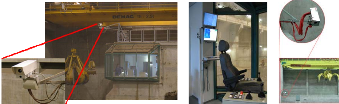
WASTE-SCAN: Brandfrüherkennung von Bunkern, Lagerhallen und Freiflächen