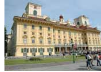
Wr. Neustadt Eisenstadt