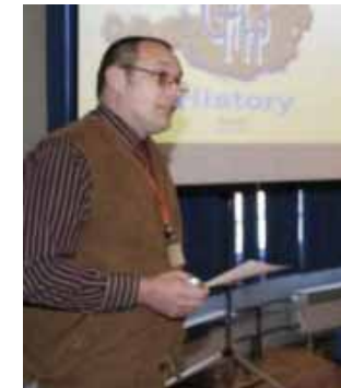
Dipl. Ing. G. Weinzierl Ingenieurbüro METEG

Limitations of 1D Heat Flow Thermography on Compounds using Flash Sources